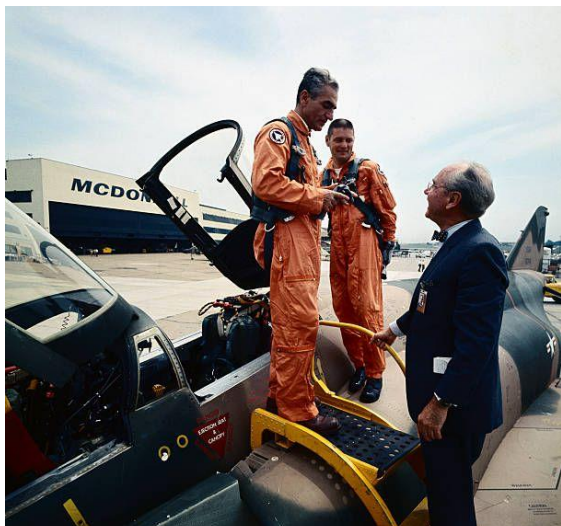
図2 F4ファントム戦闘機と国王

1964年10月、議会がアメリカ軍関係者と、その軍事顧問に外交特権を付与する法案を通過させ、続いて武器購入のため、アメリカからの2億ドルの借款に同意すると、同月27日、ホメイニは、コム自邸の前でこれらの議会の措置を強く否定する声明を行った。