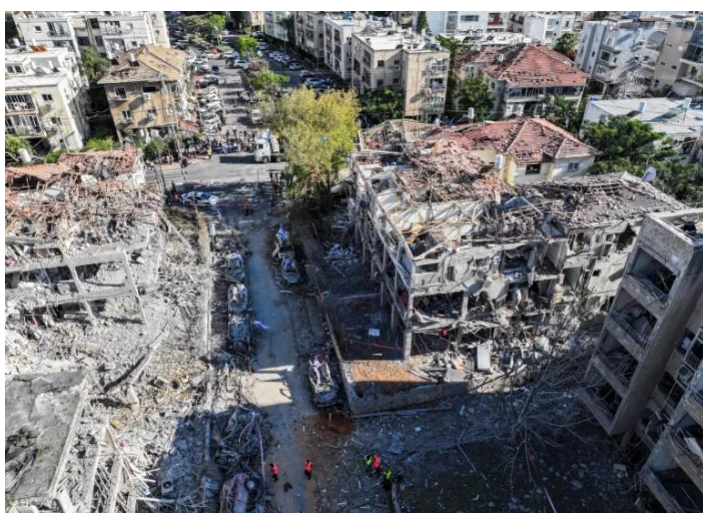
図4 イランの攻撃を受けたイスラエル・テルアビブの住宅地区

イスラエルでは軍の情報統制によって被害状況が明らかにされていないが、ハイファ製油所は被害を受け、テルアビブでもイランのミサイルやドローンの着弾が頻繁に報告された。イスラエルが誇るとされていたアイアンドーム、アロー迎撃ミサイルなど迎撃態勢が万全なものではないことが明るみになった。イスラエルは迎撃ミサイルを使い果たしたと見られ、それもまたイスラエルの停戦受け入れとなった可能性がある。