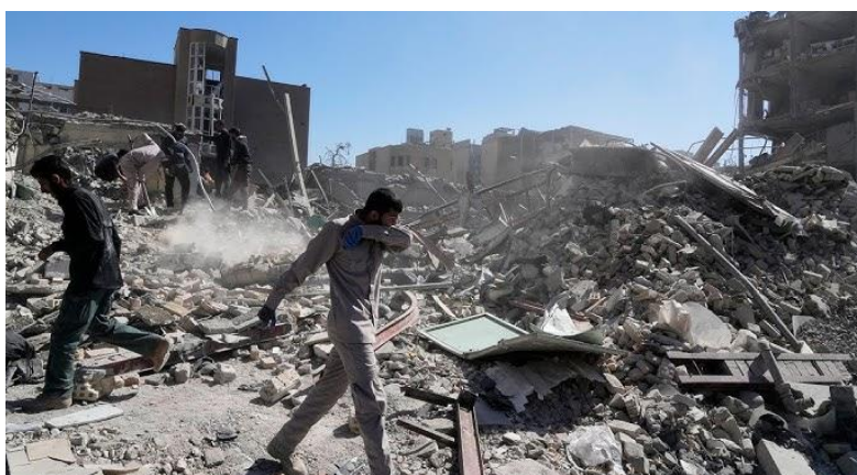
図3 イランの攻撃を受けたカタールの米軍関連施設

アメリカ・イスラエルはイラン・イスラム共和国体制を打倒すると言って国際法に違反する戦争を開始し、ハメネイ最高指導者を開戦当日の2月28日に殺害したが、最高指導者を選ぶ専門家会議はハメネイ師の息子のモジタバ・ハメネイ師を後継者として即座に選出した。アメリカ・イスラエルは文民から登用されたアジーズ・ナシールザーデ国防相をやはり開戦当日に殺害し、後任にはマジド・エブネ・レザー革命防衛隊将軍が就いた。また、アメリカ・イスラエルは、現実的な文民のアリー・ラリジャニ国家安全保障最高評議会事務局長も殺害し、その後任には強硬派のモハンマド・バゲル・ゾルガドル元革命防衛隊将軍が就任した。アメリカ・イスラエルは中道・穏健派の政治指導者たちを次々と殺害し、極右の反米・反イスラエルの強硬派の人物たちに置き換えていった。